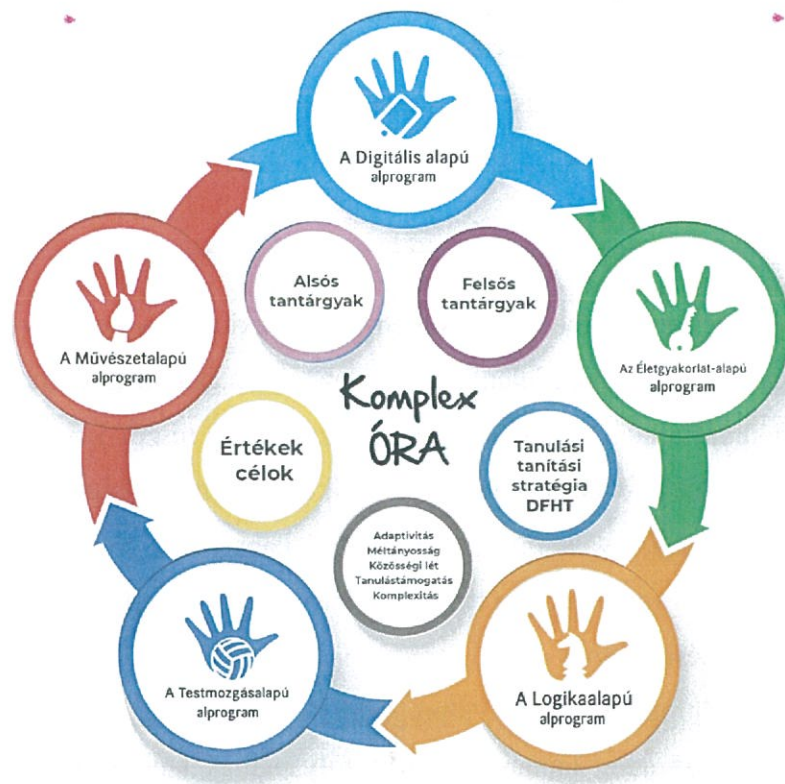
A Komplex órák felépítése