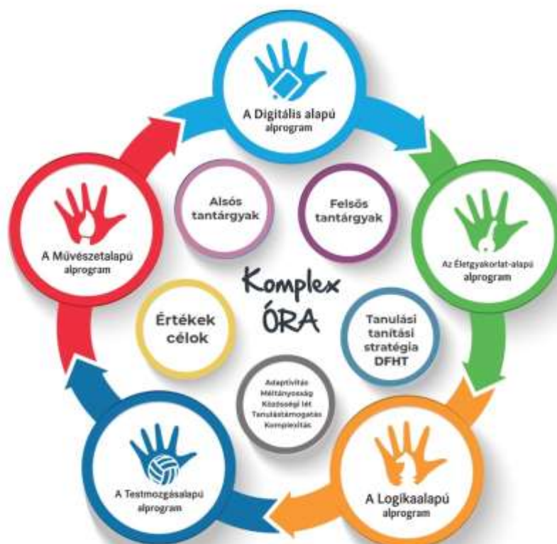
A Komplex órák felépítése